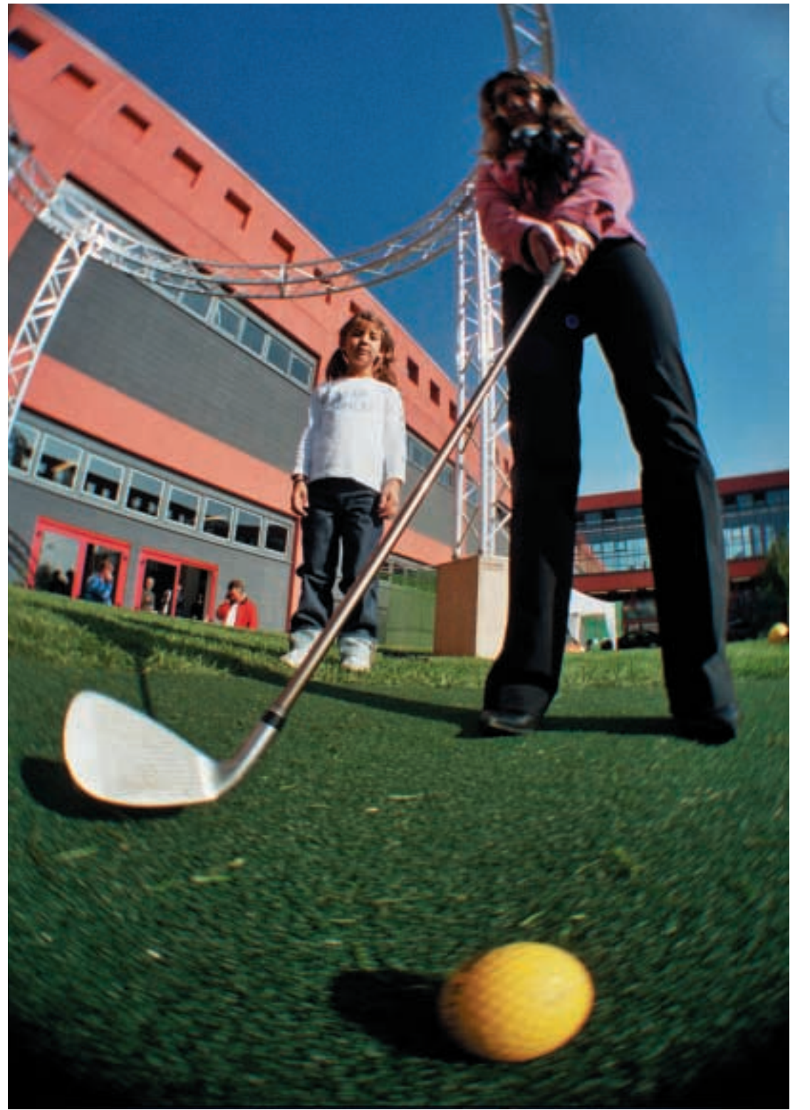
L'eleganza degli sport varesini, equitazione, vela e golf, si adagia negli scenari più diversi ma sempre pieni di fascino The elegance of the sports in Varese, such as golf, sail and horse riding, matches with different and charming landscape of our Province