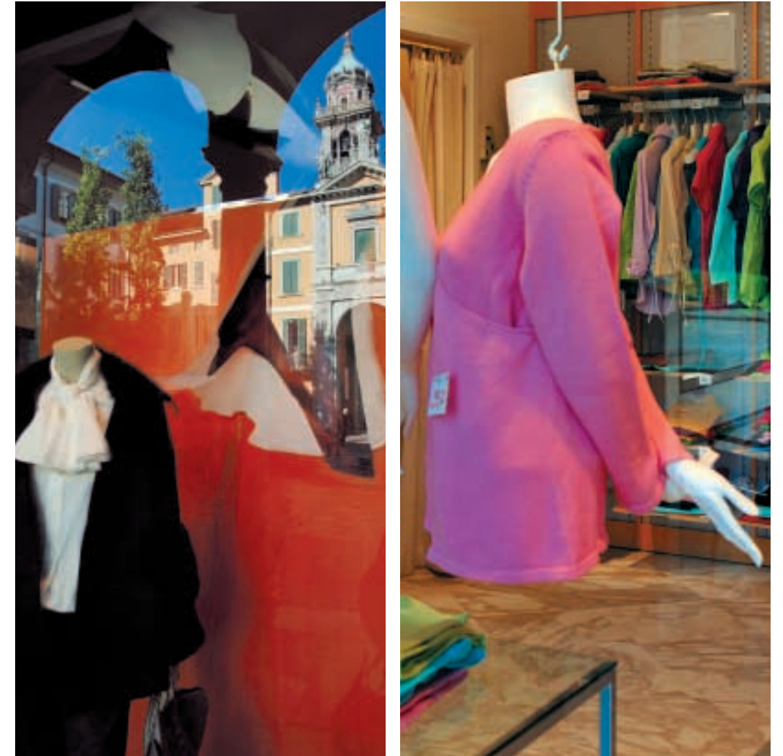
Tradizione e attualità nello shopping a Varese Shopping through tradition and innovation in Varese