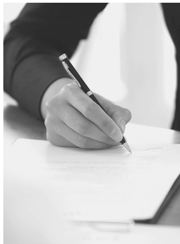
SELEZIONE PRODOTTI E REGISTRAZIONE ALLA DUBAI MUNICIPALITY