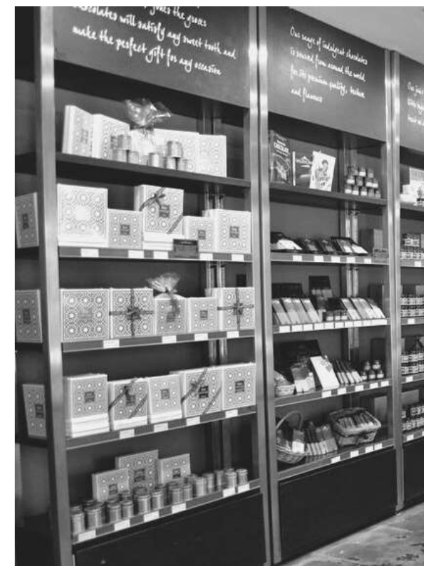
TEMPORARY EXPO Italian Food Days@Expo Dubai 1 / 5 MESI