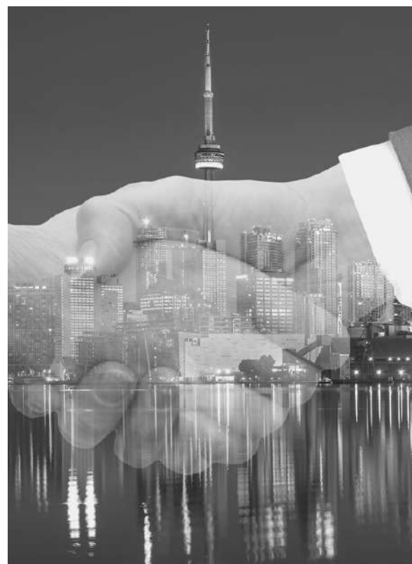
PUBBLICITÀ E DEGUSTAZIONI